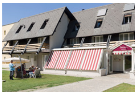
Foyer de La Tzoumaz

La Tzoumaz / Accès au site d'agrotourisme social