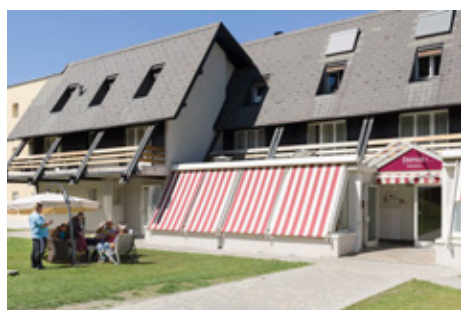
Foyer de La Tzoumaz

La Tzoumaz / Accès au site d'agrotourisme social